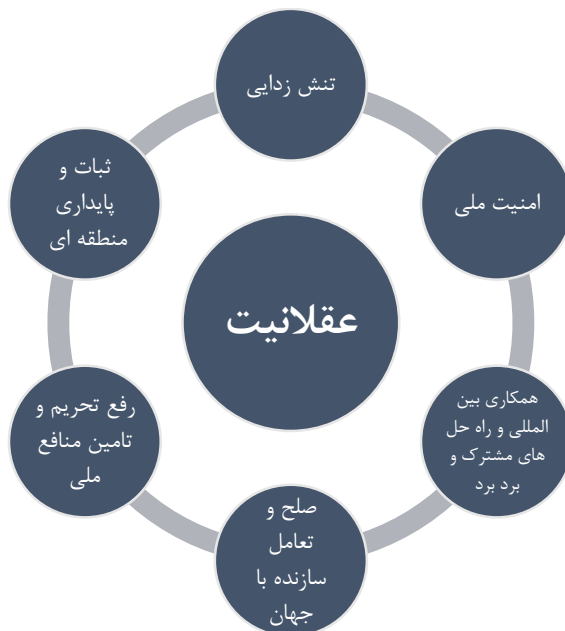
شکل ۱. مفصل‌بندی گفتمان عقلانیت در موضوع برجام