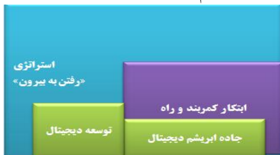
شکل ۱. سیاست رفتن به بیرون و توسعه دیجیتال چین (نگارندگان ۱۴۰۳)

در ادامه سیاست رفتن به بیرون و ابتکار کمربند و راه، گسترش دیجیتال به‌عنوان صفحه‌ی اصلی و جدید سیاست خارجی چین ظهور کرد (Cheney, 2019:4) که زمینه برای ایجاد ابتکار در زمینه دیجیتال در سال ۲۰۱۵ را فراهم نمود.