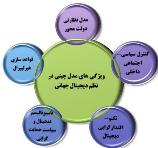
شکل ۳. ویژگی الگوی چینی در چارچوب جاده ابریشم دیجیتال (نگارندگان، ۱۴۰۳)

مدیریت رسانه و اطلاعات ترتیب داد. چین مدل حکمرانی دیجیتال غیرلیبرال خود را بدون نوشتن مستقیم از سال ۲۰۱۸ به بعد در کشورهای کامبوج، فیلیپین، سنگاپور، تایلند و... گسترش داد (Funk, 2019). این اقدامات چین شبکه غیرلیبرال چین را در نظام جهانی افزایش می‌دهد و حلقه‌های از هنجارهای غیرلیبرال را بین دولت‌های مختلف ترویج می‌کند