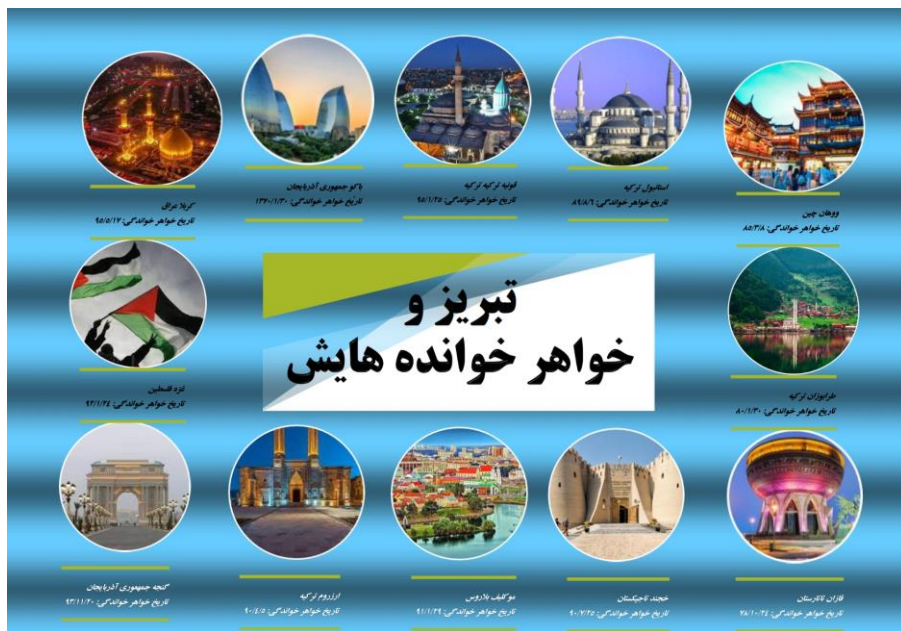
شکل ۱. تبریز و خواهر خوانده‌های آن