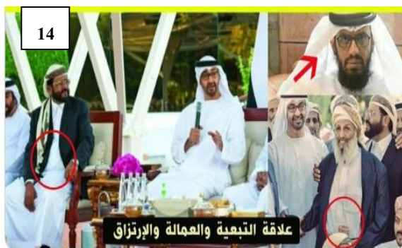
تصویر شماره ۱۴: دیدار شیوخ یمن با ولیعهد ابوظبی با خنجرهای غلاف شده (۲۰۱۹)

دیدارها، کاربران تفاوت را در این تصویر میان رابطه مبتنی بر احترام متقابل و افتخار به هویت با رابطه وابستگی و مزدوری دانسته‌اند... (شبکه العالم، ۱۳۹۸)؛ (Al-Alam network, 2019). گفتنی است در دیدار شیوخ یمن با ولیعهد ابوظبی،... آن‌ها خنجرهای خود را از غلاف خارج کردند؛ که در سنت یمن، خارج کردن خنجر از غلاف، توهینی به مرد یمنی محسوب می‌شود... این در حالی است که عبدالسلام در دیدار با رهبر انقلاب با لباس کامل یمنی حاضر شد، که نشان‌دهنده‌ی احترام متقابل دو کشور به سنت‌های همدیگر است. این دیدار، نشان‌دهنده ثبات موضع ایران در مخالفت با تجاوز به یمن به اشکال مختلف آن است.