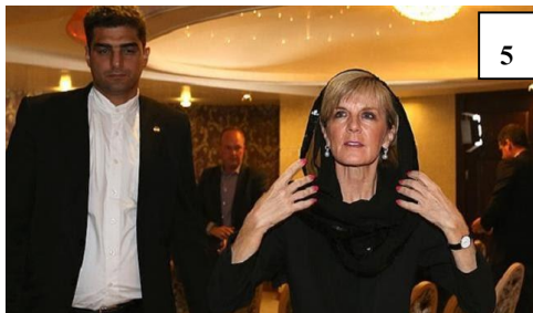
تصویر شماره ۵: پوشش سر خانم نیستنجولی بیشاپ در دیدار با رئیس‌جمهور ایران (فروردین ۱۳۹۴) Picture No. 5: Australian foreign minister, Julie Bishop's head covering in a meeting with the President of Iran (April 2014)

باشد». وزیر خارجه استرالیا افزود، بنابراین، وقتی کسی از من می‌خواهد برای دیدار با رئیس‌جمهور روسی سر کنم، من روسی سر می‌کنم. می‌خواهیم باز هم به ایران بیاییم... (تصویر شماره ۵) (سایت خبری فردا، ۱۳۹۴)؛ (fardanewswebsite, 2015).