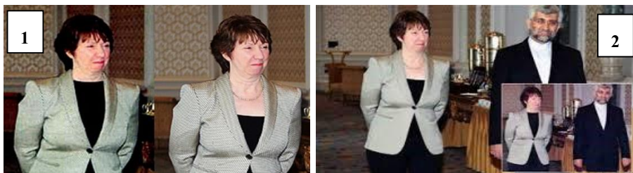
تصویر شماره ۱: پوشش خانم کاترین اشتون در مذاکرات استانبول (بهمن ۸۹) (خبر آنلاین، ۱۳۹۲)

پیام‌های مهمی را در پی داشت که می‌تواند بیان‌گر پیشرفت مذاکرات و کاهش بی‌اعتمادی دو طرف به یکدیگر باشد.. (سایت انتخاب، ۱۳۹۱)؛ (Choice website, 2012) (تصویر ۴). این نوع تغییر در پوشش، آن‌هم بدون دریافت هرگونه تذکر از جانب طرف مقابل، این‌گونه تعبیر شده است که اروپا حاوی پیامی غیرمستقیم و با احترام است که ما حاضریم در مذاکرات کوتاه بیایم.