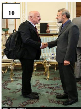
تصویر شماره ۱۰: یکی از اعضای پارلمان اروپا با کوله‌پشتی در برابر رئیس مجلس ایران (۱۳۹۴)

Picture No. 10: A member of the European Parliament with a backpack in front of the Speaker of the Iranian Parliament (2014)