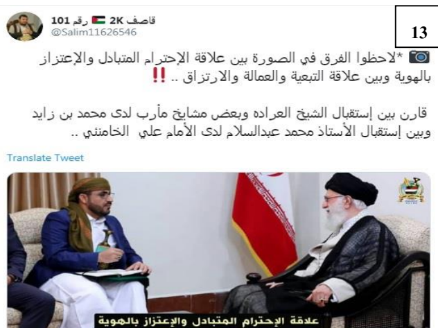
تصویر شماره ۱۳: سخنگوی جنبش انصارالله یمن در دیدار با رهبر جمهوری اسلامی ایران (۱۳۹۸)

هرچند عدم رعایت عرف پوشش دیپلماتیک می‌تواند در برخی موارد، نشان از بی‌احترامی باشد، با این حال، در مواردی نیز نه تنها بی‌احترامی محسوب نمی‌شود، بلکه خود نشان احترام متقابل و صمیمیت است. یکی از این موارد... دیدار هیئت جنبش انصارالله یمن به ریاست محمد عبدالسلام، با رهبر معظم انقلاب اسلامی است. کاربران شبکه‌های اجتماعی در جهان عرب به‌طور گسترده به این دیدار پرداختند و از خونگرمی و دوستی متقابل دو طرف در این دیدار تمجید کردند. در این باره محمد عبدالسلام پس از این دیدار، در صفحه توئیتر خود نوشت: ...رهبر انقلاب اسلامی در این دیدار بر حمایت از ملت و یکپارچگی یمن و لزوم حل و فصل اختلافات از طریق گفت‌وگوهای یمنی-یمنی و بدون دخالت خارجی تأکید کردند. وی اضافه کرد: ایشان اصالت و سابقه تاریخی و تمدنی بی‌نظیر یمن را ستودند... (فرارو، ۱۳۸۰)؛ (February, 2001). هیئت انصارالله پس از دیدار با وزیر خارجه کشورمان با رهبر معظم انقلاب دیدار کردند که بازتاب گسترده‌ای در میان کاربران شبکه‌های اجتماعی داشت. یکی از موضوعاتی که در شبکه‌های مجازی داغ شده است تصویر این دیدار بود. محمد عبدالسلام سخنگوی جنبش انصارالله یمن، در این دیدار با خنجر در غلاف که نماد مردانگی یمنی‌هاست، حاضر شد (تصویر ۱۳).