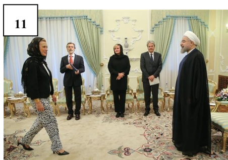
تصویر شماره ۱۱: پوشیدن پیژامه توسط زن دیپلمات در دیدار با رئیس‌جمهور ایران