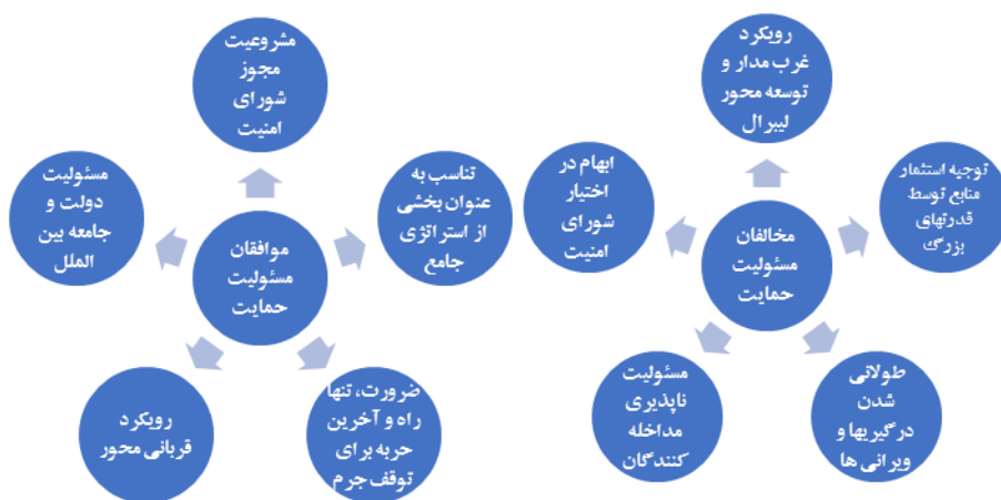
شکل ۲- استدلال‌های موافقان و مخالفان دکترین مسئولیت حمایت

در این چارچوب، در آوریل ۲۰۰۶ دکترین مسئولیت بین‌المللی حمایت، رنگ قانونی به خود گرفت. شورای امنیت با بررسی و تصویب سند نهایی مصوب اجلاس سران، بر اساس قطعنامه ۱۶۷۴ درباره حمایت از غیر نظامیان در منازعات داخلی، این مفهوم را قانونی اعلام کرد و دبیر کل سازمان ملل در گزارش سال ۲۰۰۹ اجرای «مسئولیت بین‌المللی حمایت» را اعلام نمود (Sadeghi-Haghighi, 2011: 111). با این وجود، همچنان دو دیدگاه موافق و مخالف درباره اجرای این دکترین در میان اندیشمندان حقوق بین‌الملل وجود دارد (Erdogan, 2016: 33-43).