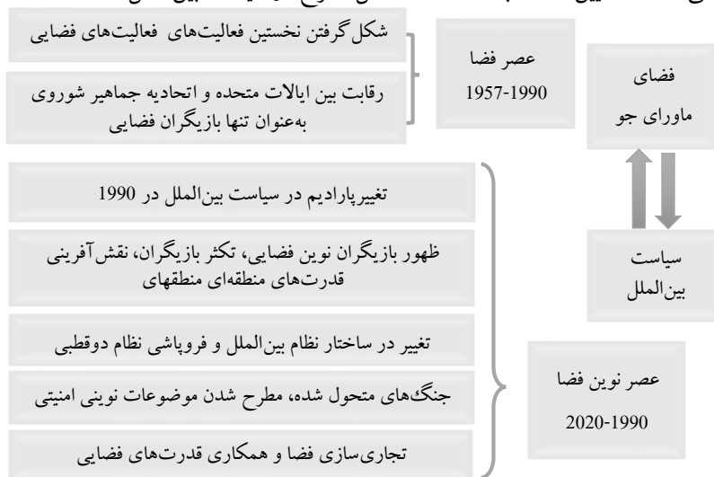
مدل ۲- تأثیر متقابل سیاست بین‌الملل و فضای ماورای جو

فضای ماورای جو و کاربرد فناوری‌های فضایی، یکی از نیروهای محرکه تحولات سیاست بین‌الملل در دوران جنگ سرد و پس از آن محسوب می‌شوند و بر این مبنای سیاست‌گذاران را به تدوین استراتژی‌ها و سیاست‌های فضایی ملزم کرده‌است. تغییر سیاست‌گذاری‌های فضایی ناشی از نقش‌آفرینی فناوری‌های فضایی در تحولات سیاست بین‌الملل تأکیدی بر ضرورت فهم تازه‌ای است. در بستر تعریفی از کنت والتز «نظریه روابط بین‌الملل تبیین‌کننده قوانین سیاست بین‌الملل است» (Waltz, 1979:8). بدین ترتیب درک و فهم تازه‌ای از سیاست بین‌الملل در قرن بیست و یکم و عصر نوین فضا، بیش از هر چیز نقش و کارکرد نظریه‌ها و تغییرات صورت گرفته در پارادایم را پررنگ می‌کند که تعیین‌کننده ابعاد مختلف مسائل مطرح در سیاست بین‌الملل هستند.