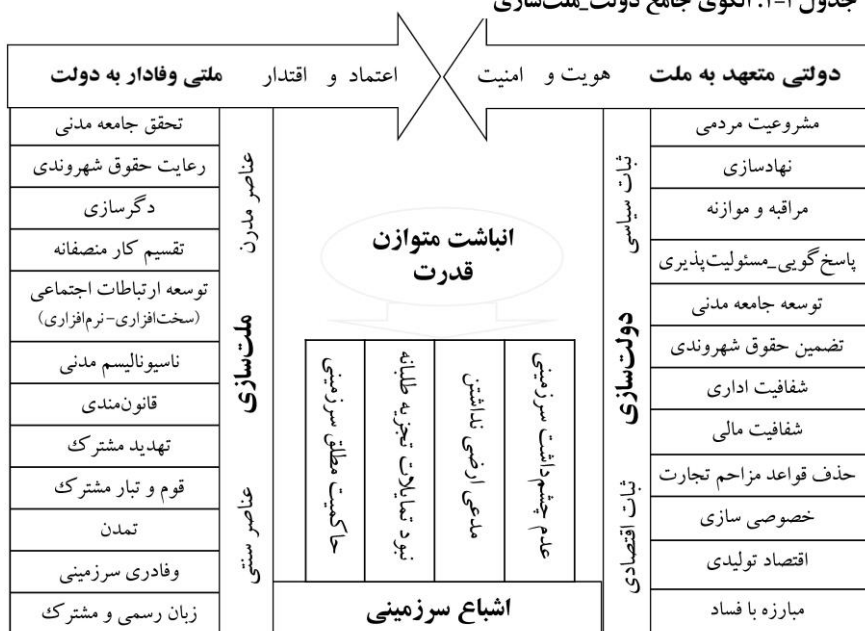
جدول ۳-۱: الگوی جامع دولت-ملت‌سازی

و نیز «با افزایش شفافیت، ۲ حکمرانی ثبات بیشتری خواهد یافت» (PourEzzat, 2008: 285). و «با دستگاه قضایی مستقل در کنار رسانه‌های مسئول، شفافیت ضمانت می‌شود» (PourEzzat and Taheri, 2010: 182). همچنین «دولت مردمی با تقویت جامعه مدنی به مشارکت داوطلبانه و فعال شهروندان می‌پردازد» (Jafari and Zolfaghari, 2014: 87-89). و با پذیرش نقد و نظارت آنها کارآمدی خود و اعتماد اجتماعی را افزایش می‌دهد.