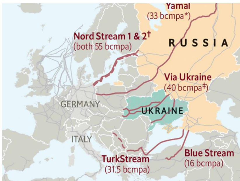
شکل ۱. خطوط لوله گاز طبیعی روسیه به اروپا

علی‌رغم همه آن تلاش‌ها که انجام شد تا انتقال گاز طبیعی میان شوروی و آلمان صورت نگیرد، آن خط لوله ساخته شد و موجب شد که کمپانی‌های انرژی روسیه همچون گازپروم بزرگ و بزرگ‌تر شده، و همچنین استخراج منابع، صادرات انرژی، و خطوط لوله گاز روسیه به سمت اروپا بیشتر و بیشتر شود. پس از آن ساخت خط لوله گاز یامال-اروپا در سال‌های آغازین پسا فروپاشی اتحاد جماهیر شوروی آغاز شد تا گاز طبیعی ذخائر سیبری غربی از طریق خاک بلاروس به لهستان و آلمان منتقل شود، و اکنون روسیه به صورت کلی دارای ۹ خط لوله نفت و گاز به سوی اروپا است (شکل ۱). تا قبل از تجاوز نظامی روسیه به خاک اوکراین، در ۲۰۲۱ اروپا بابت حدود ۴۹ درصد (۱۶۷ میلیارد متر مکعب) از تقاضای گاز طبیعی، ۳۰ درصد (۱۳۸/۷ میلیون تن) از تقاضای نفت، و ۴۸ درصد (۲/۱۱ اگراژول) از تقاضای ذغال سنگ خود وابسته به روسیه بود (BP, 2022).