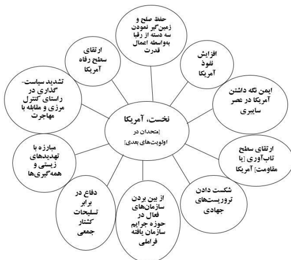
شکل شماره ۱: مفصل‌بندی گفتمان امنیتی- نظامی ایالات متحده در دولت ترامپ (نگارندگان، ۱۴۰۱)

- [ستون چهارم منافع ملی حیاتی ایالات متحده]: ... افزایش نفوذ آمریکا [به واسطه سه اقدام]: (۱) تشویق شرکای مشتاق؛ (۲) دستیابی به نتایج بهتر در مجامع [و کنفرانس‌های] چندجانبه؛ (۳) پشتیبانی از ارزش‌های آمریکایی ... (The White House, 2017: 37-4۲). با تدقیق در متن سند «استراتژی امنیت ملی» ایالات متحده در سال ۲۰۱۷ می‌توان گفت که وقته‌های گفتمان امنیتی- نظامی ایالات متحده در دولت ترامپ شامل ده مورد مطابق شکل شماره یک می‌باشد.